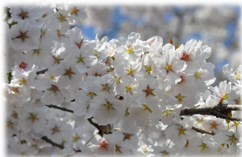
水戸キャンパスの桜