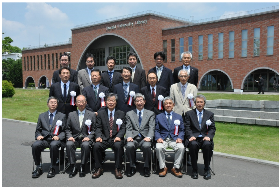
称号授与式後の記念写真