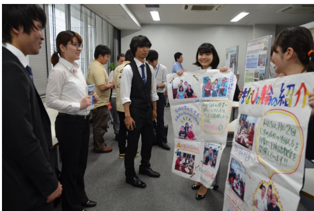
後半のポスター発表にも多くの参加者が 駆けつけた