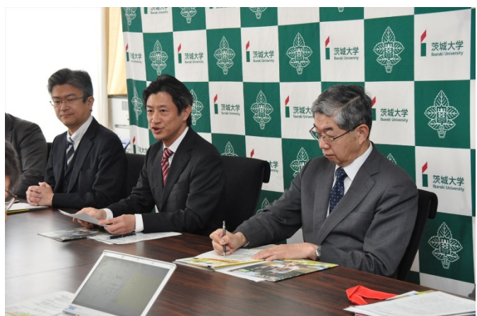
看板上掲にあわせて実施された記者懇談会にて