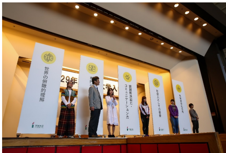
ディプロマ・ポリシーを示したパネルを前に。 それぞれの目標を象徴する在学生も登場。