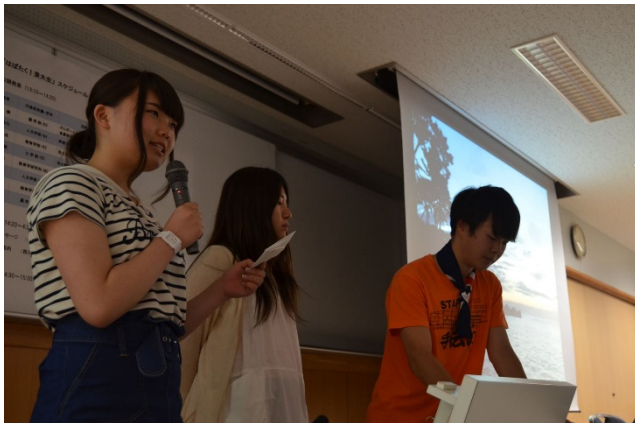
活動を紹介する学生たち（写真は岡倉天心・ 五浦発信プロジェクトのメンバー）